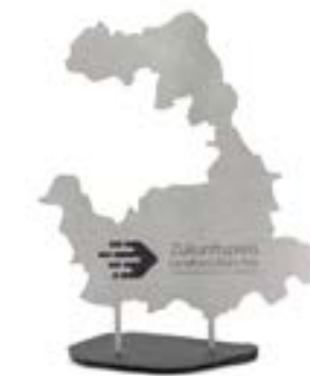
Zukunftspreis Landkreis München 2022