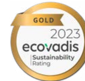
Gold-Rating durch EcoVadis