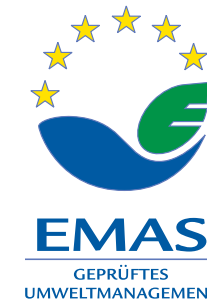
EMAS Europäischer Umweltstandard